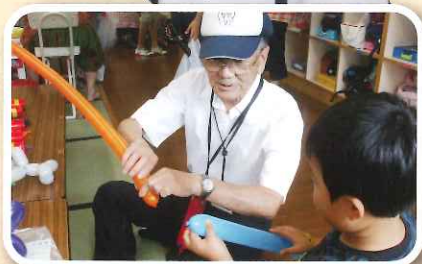
子どもルームのイベントに参加しました

バルーンアートのサークルを 立ち上げ、今では会員が16人 にもなるそうです。地域のイベ ントでの講習や、子どもたちに プレゼントも。レパトリーは 数えきれないとのこと!