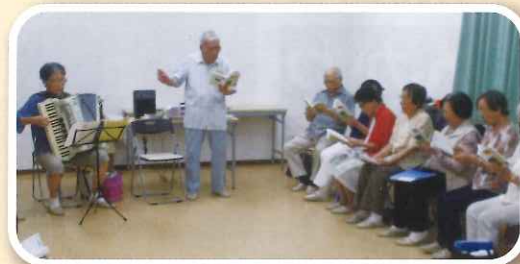
「つくし会」の練習に参加