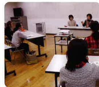
先輩協力会員さんからの経験談に耳を傾けて