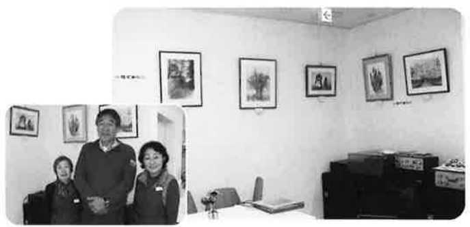
スタッフの皆さん

週に1回、隣にあるホームクリニック東葛の医師や地域の皆さまによる介護予防の勉強会を開催しています。参加希望の方は、直接カフェにお越しください。