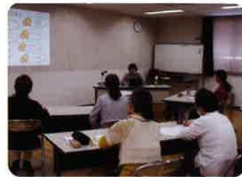
助産師さんの講義

子育て方法は日々変化しています。何年も前に産前産後支援研修を受けた協力会員さんも、今後は是非ご出席いただきたいと思えます。