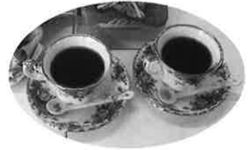
淹れたてのコーヒー