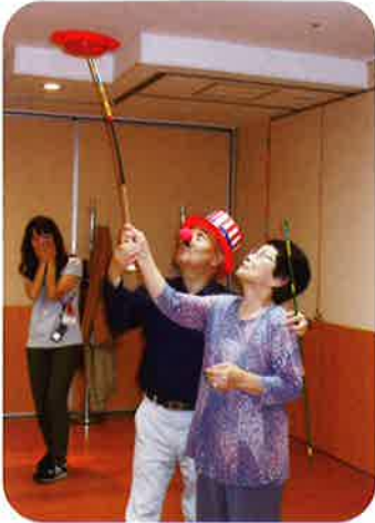
下地協力会員と山本利用会員の奥様 皿回し大成功