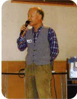
大橋利用会員 「三つで五百円」熱唱中!