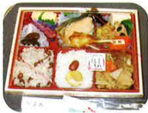
おこわ米八のお弁当