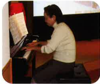
蓮實協力会員 「子犬のワルツ」独奏