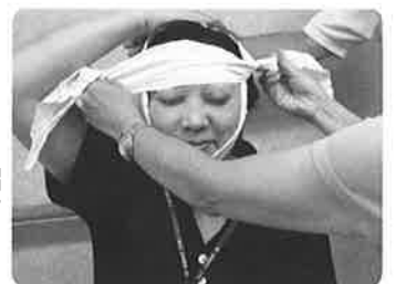
⑤ おでこ後頭部の出っ張りの下を通す