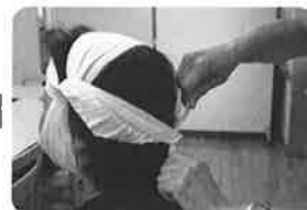
⑥ 後頭部の中心でギュッとしばる