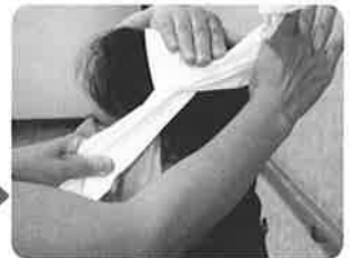
④ 耳の少し上でクロスする