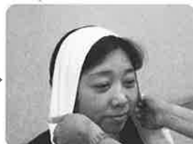
② 傷口を押さえるように置く