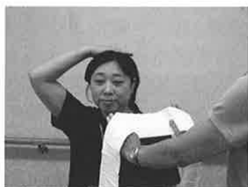
① 8つ折三角巾の中央を左右どちらかに少しずらして持つ