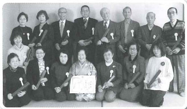
さわやかサービス顕彰者の皆さん (平成27年度の対象者24名中16名の方)