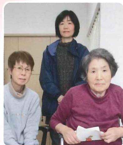
来訪されていた娘様と一緒に