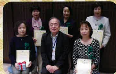
当日出席の皆さんと秋山局長