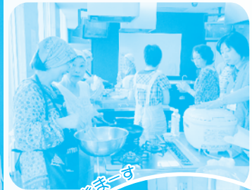
ご飯が炊けないな