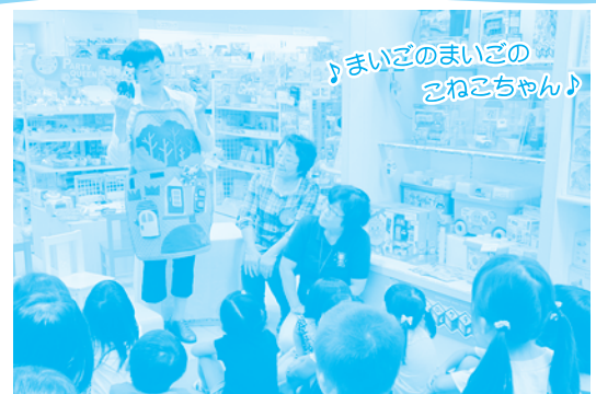
♪まいごのまいごのこねこちゃん♪

8月25日(日)『かしわ街ごとキッズニア』のイベントとしてそごうファミサポおはなし会を開催しました。4人の地区リーダーさんによる大型絵本の読み聞かせ、手遊び、エプロンシアター等を、午前と午後で延べ26名の大人と31名の子どもたちが楽しみました。