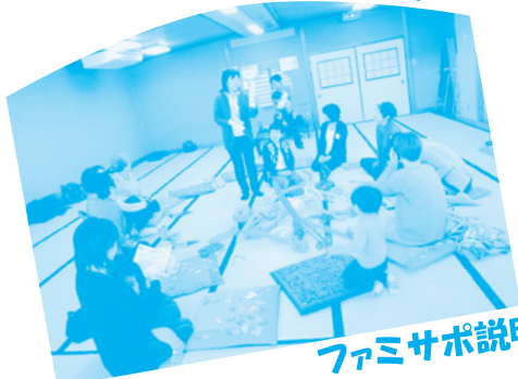
ファミサポ説明中