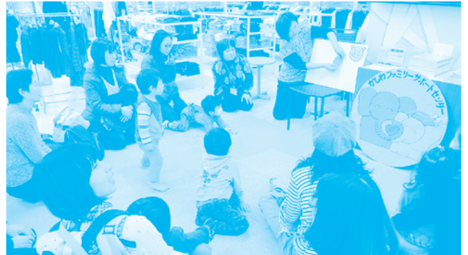
身を乗り出す子どもたち

2月7日と3月29日柏とぞうのおしゃれステージではなし会とファミサポ相談会を開催しました。