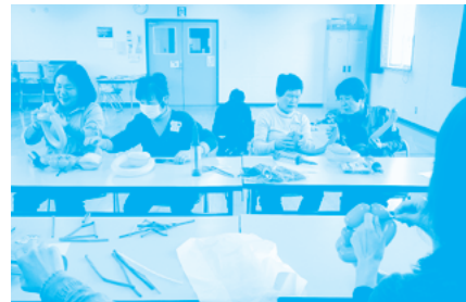
協力会員ががんばっています