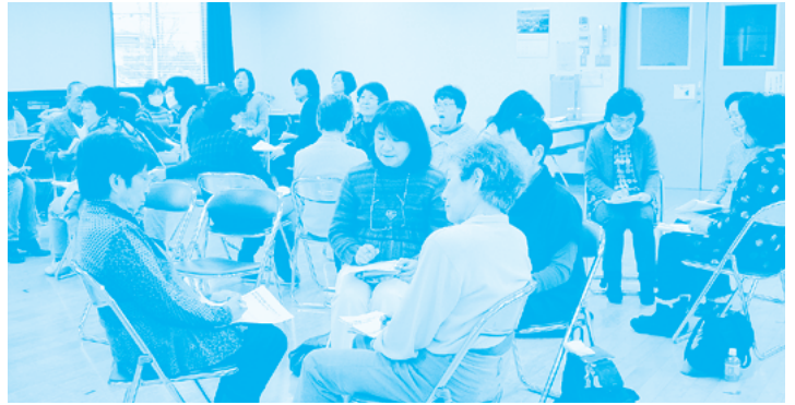
グループで意見交換しながら・・・