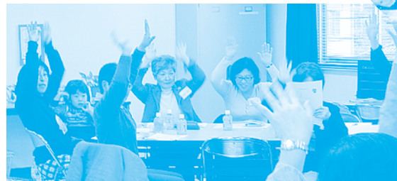
ディスカッションのあとは、ぶたさんの手遊びの時間♪