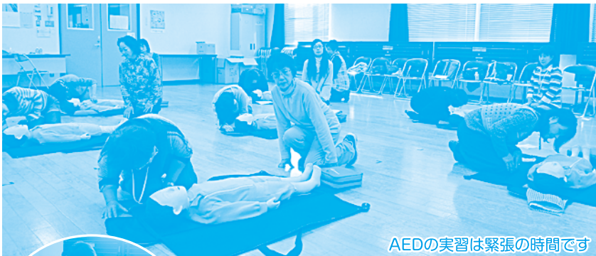
AEDの実習は緊張の時間です