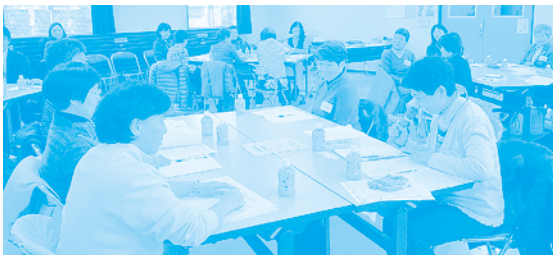
協力会員から日頃の援助の様子が、ひしひしと伝わります