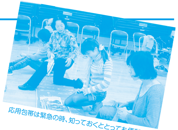
応用包帯は緊急の時、知っておくととっても便利!