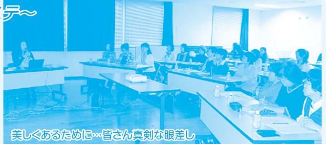
美しくあるために…皆さん真剣な眼差し

カロリー30%OFFの食事を続けることで、若さと長寿のサーチュイン遺伝子が働き始めるそうです。