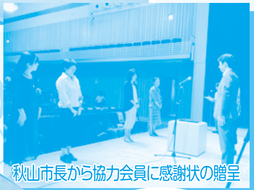
秋山市長から協力会員に感謝状の贈呈