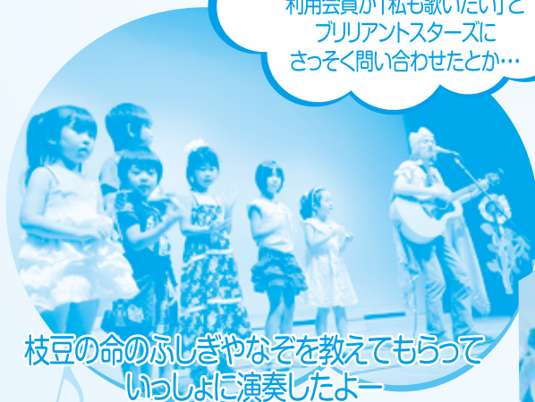
枝豆の命のふしぎやなぞを教えてもらって いっしょに演奏したよー