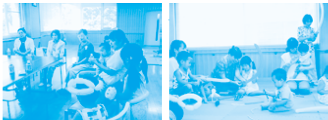
9月12日 南部地区交流会の様子 (沼南社会福祉センター)

昨年度実施したアンケートで、利用会員から「入会したものの預けるのは不安。預ける前にどんな協力会員さんがいるのか知りたい」という声がありました。そんな不安を少しでも払拭できればと、今年度は協力会員利用会員合同で交流会を開催しています。