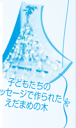
子どもたちの メッセージで作られた えだまめの木