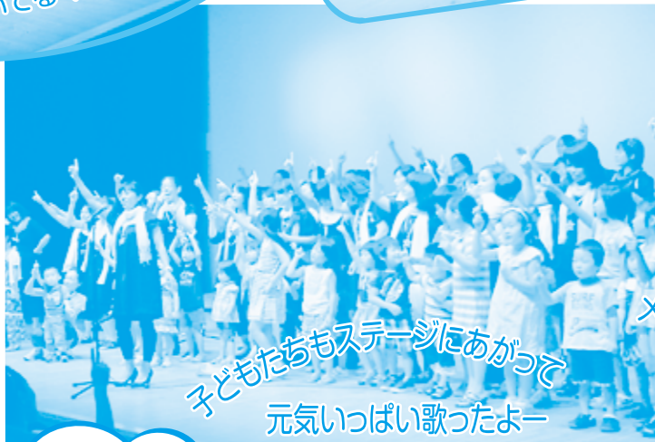
子どもたちもステージにあがって 元気いっぱい歌ったよー