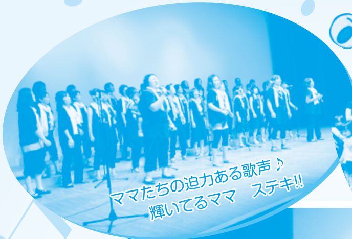
ママたちの迫力ある歌声♪ 輝いてるママ ステキ!!

ブリリアントスターズの堂々たるママたちのステージに、たくさんの元気をもらいました。 そして枝豆王子から、命のふしぎ、大切さを学び優しさあふれるステージに暑さを忘れました。