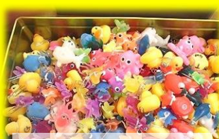
アヒル釣りグッズ