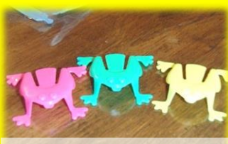
カエル飛ばしグッズ