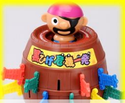
黒ひげ危機一髪 5個

お金持ちゲームに使う介護予防グッズ貸し出し <問合せ・予約申込> ☎7165-0880