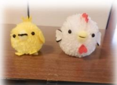
来年の干支の酉を 作りました。