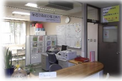
松葉近隣センター1階管理人室内に 窓口があります！

ご相談内容に応じて、福祉サービスの紹介・手続き案内・専門機関へおつなぎし、解決に努めさせていただきます。