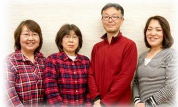
代表とコーディネーターの皆さんです☆