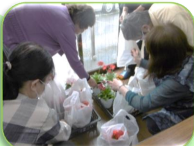
お花を用意するボランティアの皆さん

※他にも感染対策をとりながら、いろいろ工夫しているサロンがありましたら情報をお寄せください。