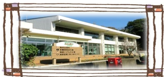
ふれあいプラザ(南部近隣センター 2階)

ちいき♡いきいきセンターは、地域の身近な福祉の相談窓口です！現在、柏市内に8か所開設しています。