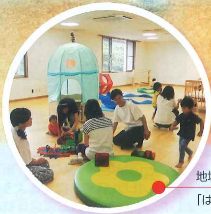
地域子育て支援拠点 「はぐはぐひろば沼南」