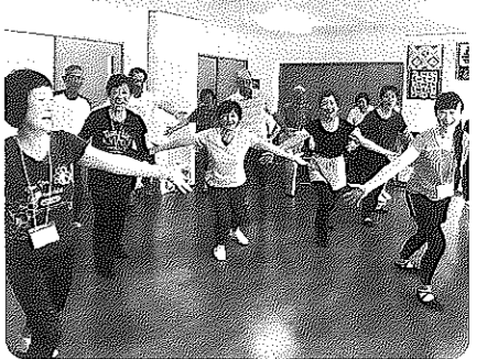
介護予防体操の様子

町会では、宮前ふれあい会館を使って、サロンや体操をしてきました。男性が出てこないということが課題でしたが、今回、回数を増やして男性が参加しやすい企画を設けることにしました。会館も男性の力でさらにぎわいを増します。補助金は、会館使用料や講師を依頼するために活用します。