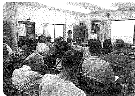
認知症サポーター研修の様子

町会で立ち上げ、活動開始して1年が過ぎました。町会の方々から喜ばれ少しずつ需要が増えてき、他町会からも需要があり活動範囲を広げてサービスを提供することにいたしました。補助金は電話料、事務経費等に活用しています。これからは助けあい活動をしたいと言う町会が増えて来ていますので一緒に応援していきたいと思っています。