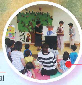
いこいのそよ風「絵本の読み聞かせ」 (第4火曜日)