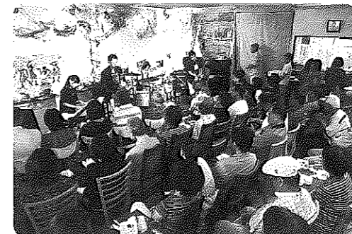
ジャズコンサートの様子

コミュニティルームはなみずき/IVY-LABO柏ビレジ商店街に位置する「はなみずき」と「IVY-LABO」が協力して介護予防に取り組むこととなりました。常設型の地域の拠点として、包括支援センター等のサポート、豊富な人材を結ぶ動きにわくわくしています。補助金は拠点の運営、家賃の一部に活用します。