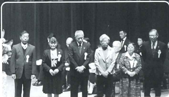
柏市社会福祉協議会会長表彰者代表の皆さん

第二部では、「ミュージックパフォーマンス～HIROSHI 120%～」と題し、柏市民バンドのSwing Beat Team HIROSHIによる会場の皆さんと一体となった演奏が多数披露され、盛会のうちに大会の幕を閉じました。