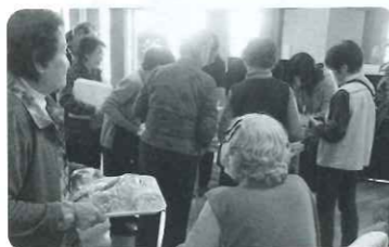
パンの販売は大好評です

地域住民をはじめ、施設入所している高齢者や家族、障がい者が自然にふれあえる場となっており、「地域と社会福祉法人の連携」「地域共生社会を見据えた居場所」など、今後の居場所づくりのモデル的な実践事例であることから、この度の受賞となりました。誠にありがとうございます。