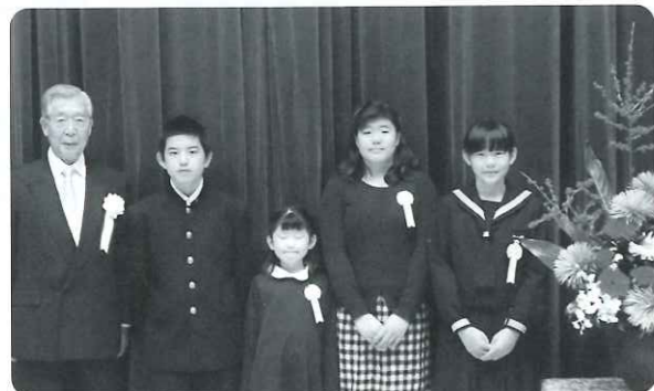
「福祉の心」作品展の表彰者の皆さんと会長