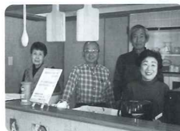
ボランティアのみなさん

平成30年6月に西原地域にスタートした“地域の居場所”です。社会福祉法人涼風会の協力により、特別養護老人ホーム「柏きらりの風」の1階にて毎週木曜日10時～16時で開催しています。