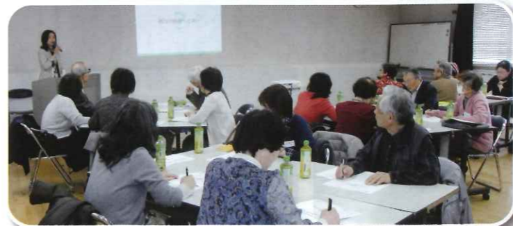
生活支援員研修会

契約者の方との適度な距離感をつくるのがとても大切だと感じています。時に寄り添ったり、距離を置いたりすることを考えて、支援しています。また、生活支援員として活動していなかったら、知らずにいたことがたくさんあります。何より活動しながら地域貢献につながっていることが嬉しいと思うようになりました。良い機会だと思って、一歩踏み出すことも思いがけない何かに出会える気がします。