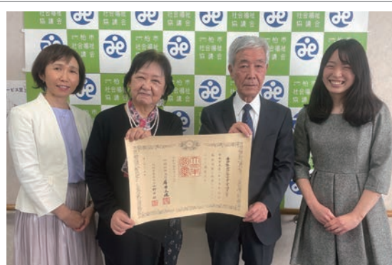
受章者の皇居宮殿見学(2月13日)後に、本会会長へ受章報告

またフェイスペイント行事で子ども達が異年齢の方々と交流し、人間関係を楽しく学ぶ機会を設けています。昨年、これまでのボランティア活動が認められ、緑綬褒章受章の栄誉を得ました。