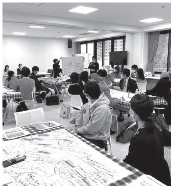
令和4年12月会議開催の様子