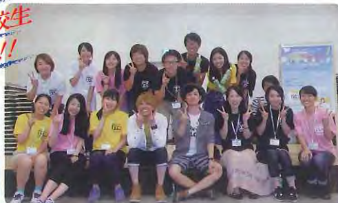
モーニングのイベントにて