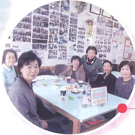
コミュニティカフェ「茶論」の皆さん