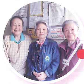
地域の助け合い活動をしている 「えがお」の皆さん