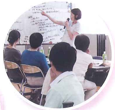
地域支えあい推進員定例会