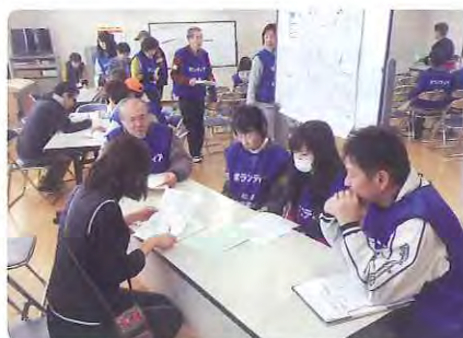
昨年の災害ボラセン設置訓練の様子

柏市で大きな災害が発生し、多くの市民が被災した場合、ボランティアによる支援活動が必要不可欠となります。被災者のニーズとボランティアをマッチングするのが災害ボランティアセンターです。社会福祉協議会は災害ボランティアセンターを設置・運営する役割があります。