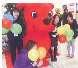
イオンモール柏にて

ボランティア活動の魅力を発信するイベントがイオンモール柏で開催され、ボラセンもボラキャンメンバーと一緒に参加しました。