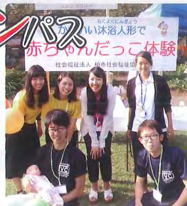
生涯学習フェスタにて