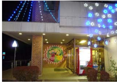
近隣センター イルミネーション