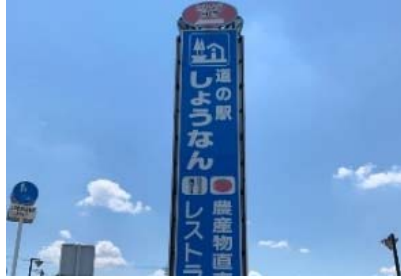
道の駅しょうなん