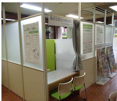
光ヶ丘地域活動センター