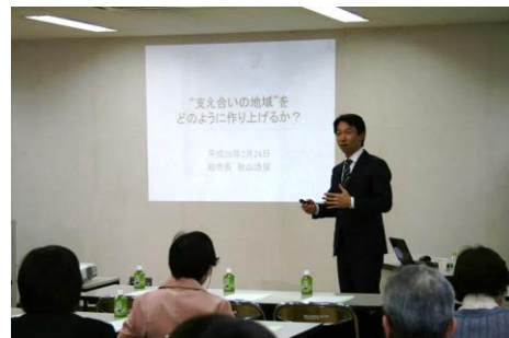
秋山市長による講演

平成26年2月、市政の方向性や社協の本質等を学び、共通認識をもって、今後の法人運営や地域福祉の推進を図るため、市長や市幹部を講師に迎え、理事・評議員合同研修を実施しました。